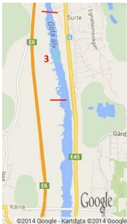
Fig 3. Surte

Lokal 3 (Surte) 57.828577,12.008314 / 57.815813,12.012549