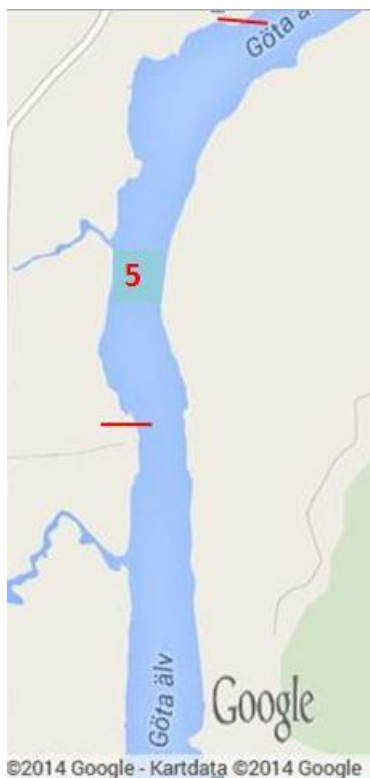
Fig 5. Stora Torp

Lokal 5 (Stora torp) Lilla edet 58.200120,12.127779 / 58.191692,12.123105