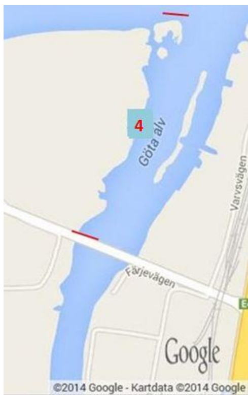
Fig 4. Kungälv

Lokal 4 (Kungälv) 57.860233,12.012155 / 57.855623,12.008139