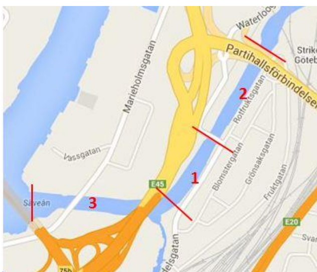
Fig 1. Lokal 1-3, Säveån.

Lokal 3. 57.725477,12.001364 / 57.721088,11.988477