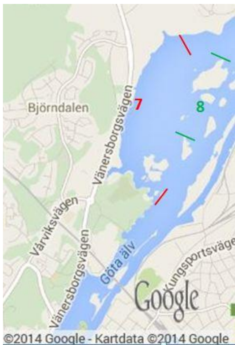
Fig 7. Lokal 7 & 8. Trollhättan.

Lokal 8 (Trollhättan 2) 58.307671,12.305102 / 58.302276,12.300737