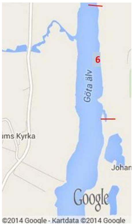
Fig 6. Hjärtum

Lokal 6 (Hjärtums brygga motsatt sida) 58.187570,12.125905 / 58.183261,12.126386