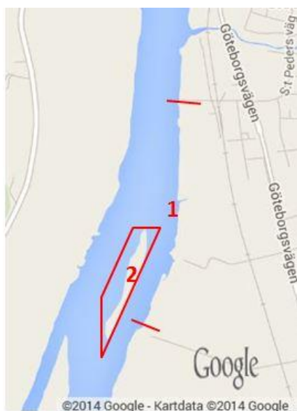
Fig. 2. Lödöse. Lokal 1-2.

Lokal 2 (Lödöse 2) Start/Slut: 58.020926 /12.14499 (Ett varv runt ön.)